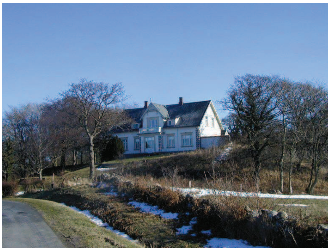
Pension Nøddebo kort før nedrivningen.