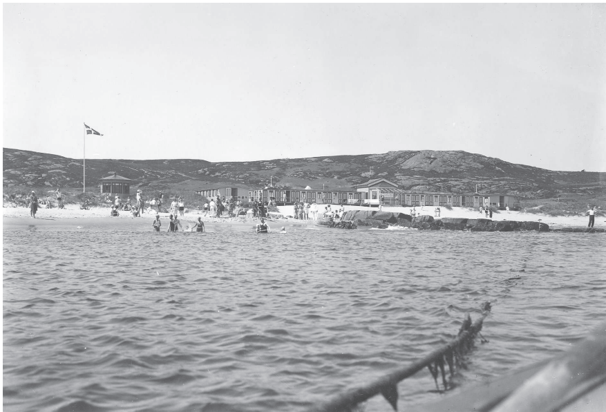
Sandvig Strand og Badehus.