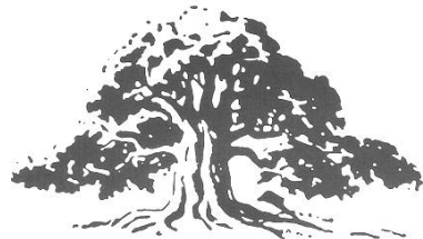
Sparekassen Bornholms Fond