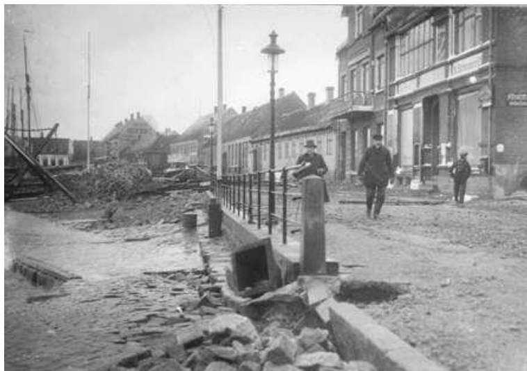
Allinge Havn efter stormfloden 1913-14.