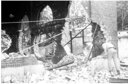
Her er man i gang med den store "overbygning"