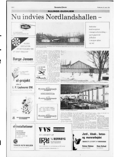
Endelig den 13/3 1976 kunne hallen indvies med en stor fest.