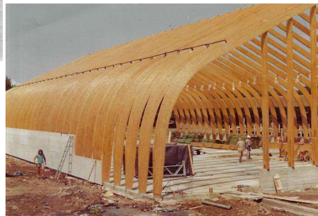
Nu går det hurtigt. 2 dage senere er alle buer stillet op, og man er begyndt med beklædningen.