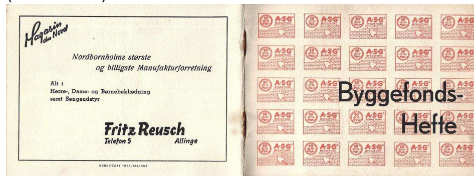
Byggefonds-hæfte fra 1938.