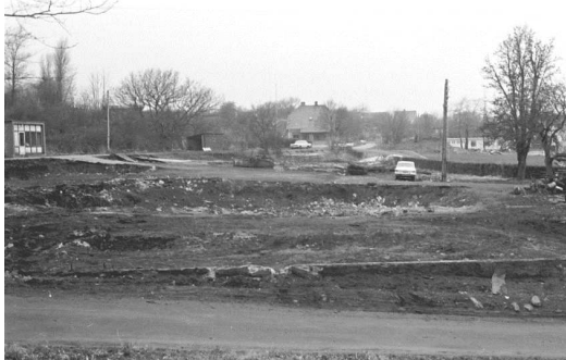
Endelig den 3/3 1975 er gasværket væk, og byggegrunden til hallen er klar.