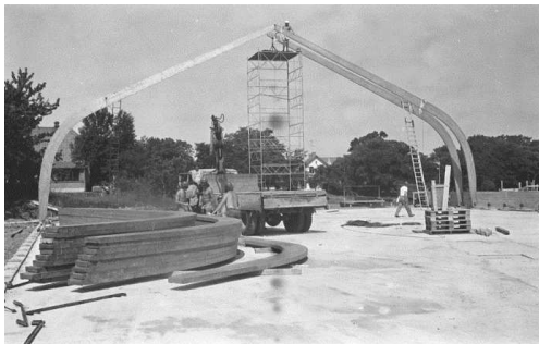
Allerede den 21/7 1975 er fundamentet støbt og de første halvbuer rejses.