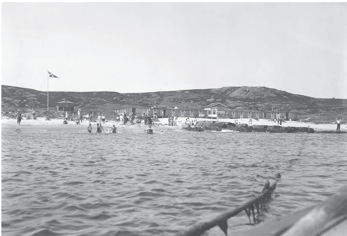
Sandvig Strand og Badehus.

1570. 16. juli kommer hen imod aften en flåde på 50 svenske skibe, hvor de 43 var orlogsskibe og resten koffardiskibe, og ankrede op ud for Sandvig. Den 20. juli forsøgte landgang, men den lokale milits, Kettinghs landsknægte og Sandvigbatterierne, afviste landgangen. Svenskerne havde mange døde, som de sendte i land bundne til brædder. Beboerne sørgede for deres begravelse. Herefter forlod skibene Sandvigbugten, men kom ud i en nordøst storm, hvor flere skibe grundstødte. Den 26. juli sejlede de sidste skibe væk.