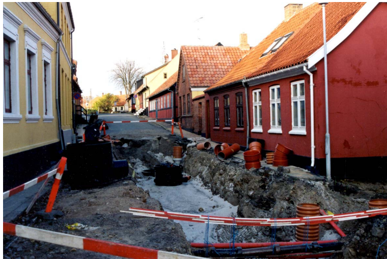
Mød godt frem - - og tag din nabo med!